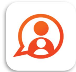
Konnnect OuderApp Konnnect B.V.